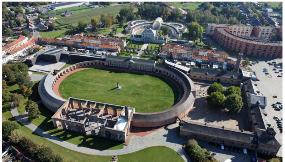
Cour Ovale du Grand-Hornu